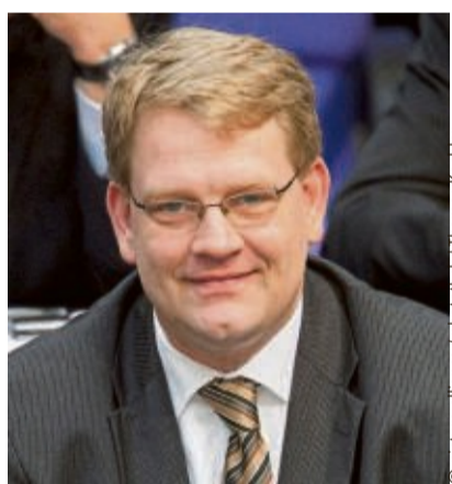
FDP-Politiker Hartfrid Wolff sprach sich gegen das verschärfte Waffenrecht aus.

22.2.2008: Bundestag verschärft Waffenrecht. Ausschreitungen an Silvester und die Putschpläne einer „Reichsbürger“-Gruppierung ließen zu Beginn des Jahres die Debatte um ein schärferes Waffenrecht in Deutschland wieder aufleben. Das Bundesinnenministerium