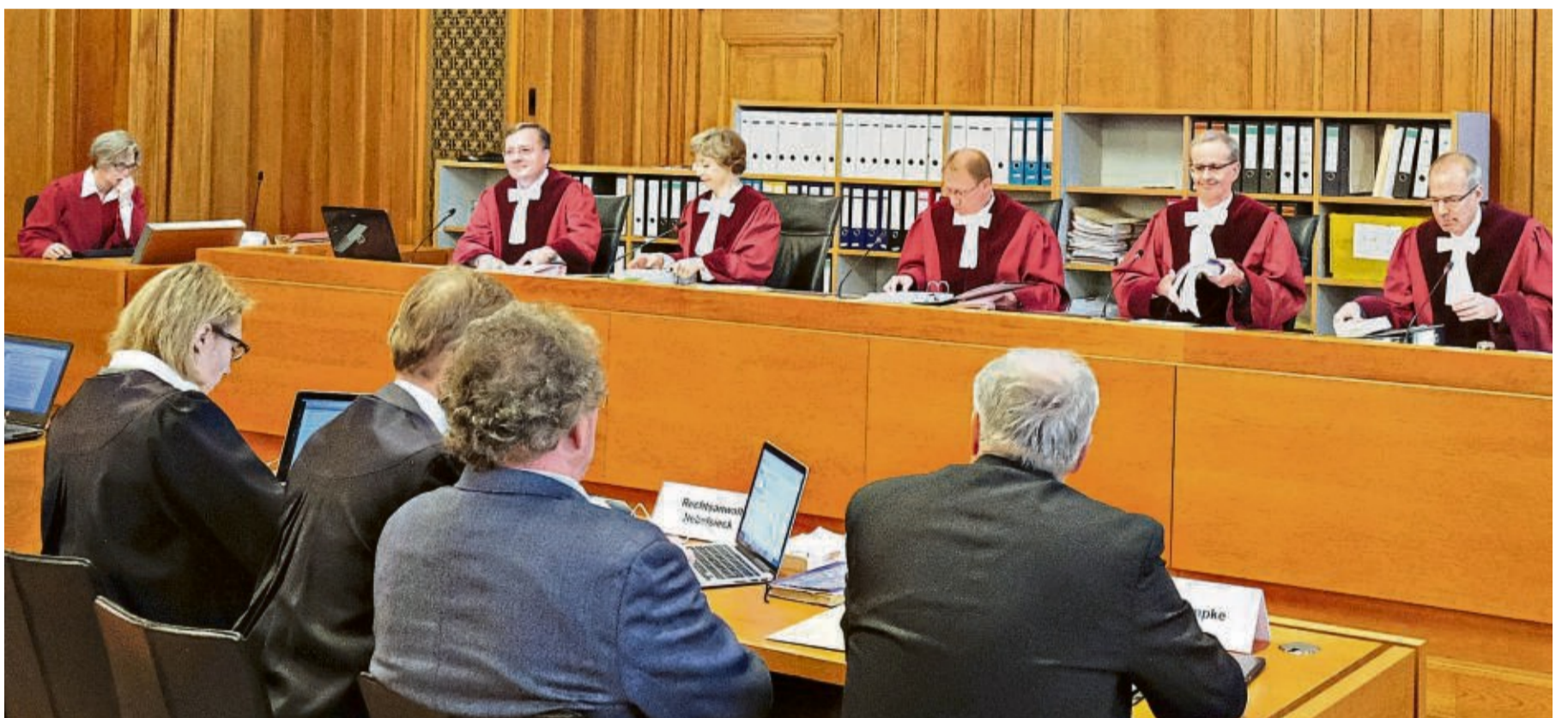
Verhandlung zur Elbvertiefung vor dem Bundesverwaltungsgericht 2016: Große Infrastrukturvorhaben landen häufig vor Gericht, diese Verfahren sollen künftig priorisiert und beschleunigt werden können.

»Gut gemeint, schlecht gemacht« Dem widersprach Stephan Mayer (CSU) ausdrücklich. Zwar hätten die Koalitionsfraktionen den „vollkommen mangelhaften und unzureichenden“ Regierungsentwurf nachgebessert, der Entwurf sei aber „noch lange nicht gut“ und „allenfalls gut gemeint, mit Sicherheit schlecht gemacht“. Er hoffe, dass er bestenfalls keine Wirkung erziele, befürchte aber, dass einige der Regelungen die Verfahren weiter verzögerten. „Wenn das das neue Deutschlandtempo ist, dann schwant mir wirklich Übles für unser Land und für die Zukunft der verwaltungsgerichtlichen Verfahren“, sagte Mayer über den Entwurf, der von der Unions- sowie der AfD-Fraktion abgelehnt wurde. Ziel des Entwurfes ist es, durch Änderungen in der Verwaltungsgerichtsordnung