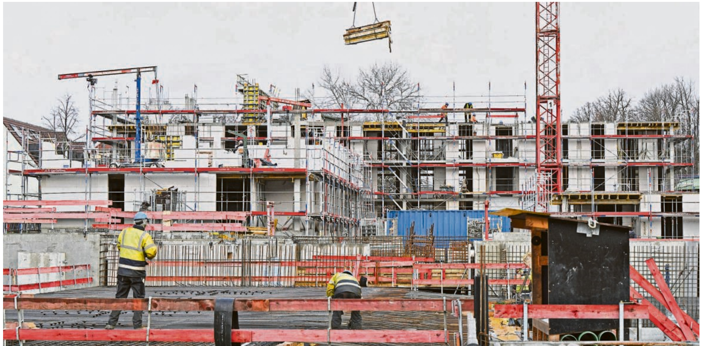
Die Bundesregierung hat ihr Ziel, jedes Jahr 400.000 neue Wohnungen zu bauen, 2022 verfehlt. Dabei spitzt sich die Wohnungskrise in Deutschland immer mehr zu. 2023 werden laut einer Studie des Mieterbundes mehr als 700.000 Wohnungen fehlen – besonders Sozialwohnungen und bezahlbare Mietwohnungen.