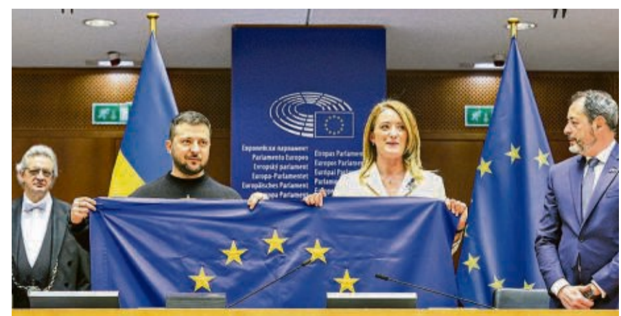
Europäisches Bekenntnis: Der ukrainische Präsident Wolodymyr Selenskyj zusammen mit Parlamentspräsidentin Roberta Metsola im EU-Parlament in Brüssel.

könnten Verhandlungen beschlossen werden – wenn Kiew wirklich alle Voraussetzungen erfüllt. Aus Sicht der meisten Staaten bedeutet das, dass nicht nur neue Gesetze verabschiedet werden, insbesondere gegen Korruption, sondern dass sie sich auch in der Praxis bewähren. Wie lange Beitrittsverhandlungen dauern würden, ist schwer zu sagen. Von der Leyen verweist öffentlich stets darauf, dass Fortschritte von den individuellen Leistungen abhängen. Es kann sechs Jahre bis zum Abschluss dauern wie bei Österreich oder selbst nach 17 Jahren keine nennenswerten Fortschritte geben wie bei der Türkei. Die meisten Fachleute in Brüssel glauben, dass die Ukraine eher mehr als weniger Zeit braucht. Tatsächlich verliert sie jeden Tag Wirtschaftskraft, weil Russland Infrastruktur zerstört. Solange das Land im Krieg mit Russland ist, kann es faktisch ohnehin nicht beitreten. Denn als Mitglied könnte es die kollektive Beistandsklausel im EU-Vertrag aktivieren (Art 42.7) – die Europäische Union will sich aber so wenig wie die Nato in einen direkten Konflikt mit Russland hineinziehen lassen. Derzeit ist Kiew auf die Unterstützung der Europäischen Union angewiesen, um überhaupt über die Runden zu kommen. Die schießt allein in diesem Jahr 18 Milliarden