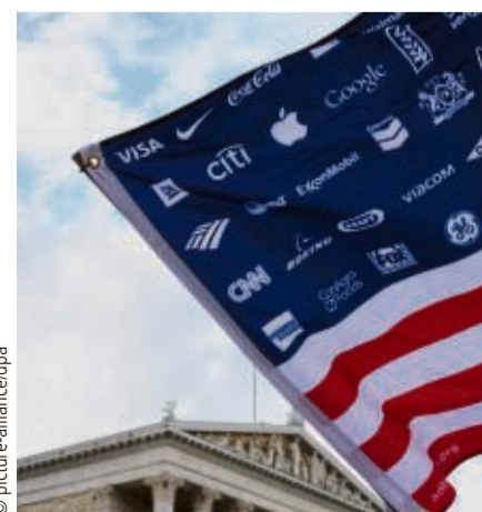
US-Konzerne müssen Steuerdaten liefern