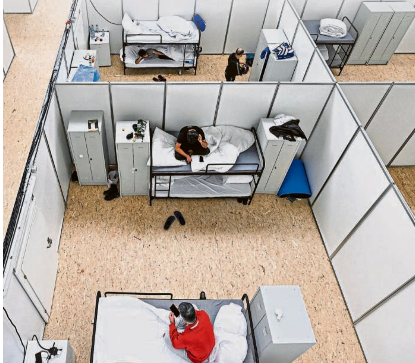
Geflüchtete in einer zur Notunterkunft umfunktionierten Sporthalle in Friedrichshafen am Bodensee. 2022 haben mehr als 923.000 Menschen Asyl in der EU beantragt, fast doppelt so viele wie im Vorjahr.

EUROPA Seit Jahren streiten die 27 EU-Staaten um ihren Kurs in der Asyl- und Migrationspolitik. Nun haben sie sich auf Maßnahmen für besseren Grenzschutz und schnellere Abschiebungen geeinigt