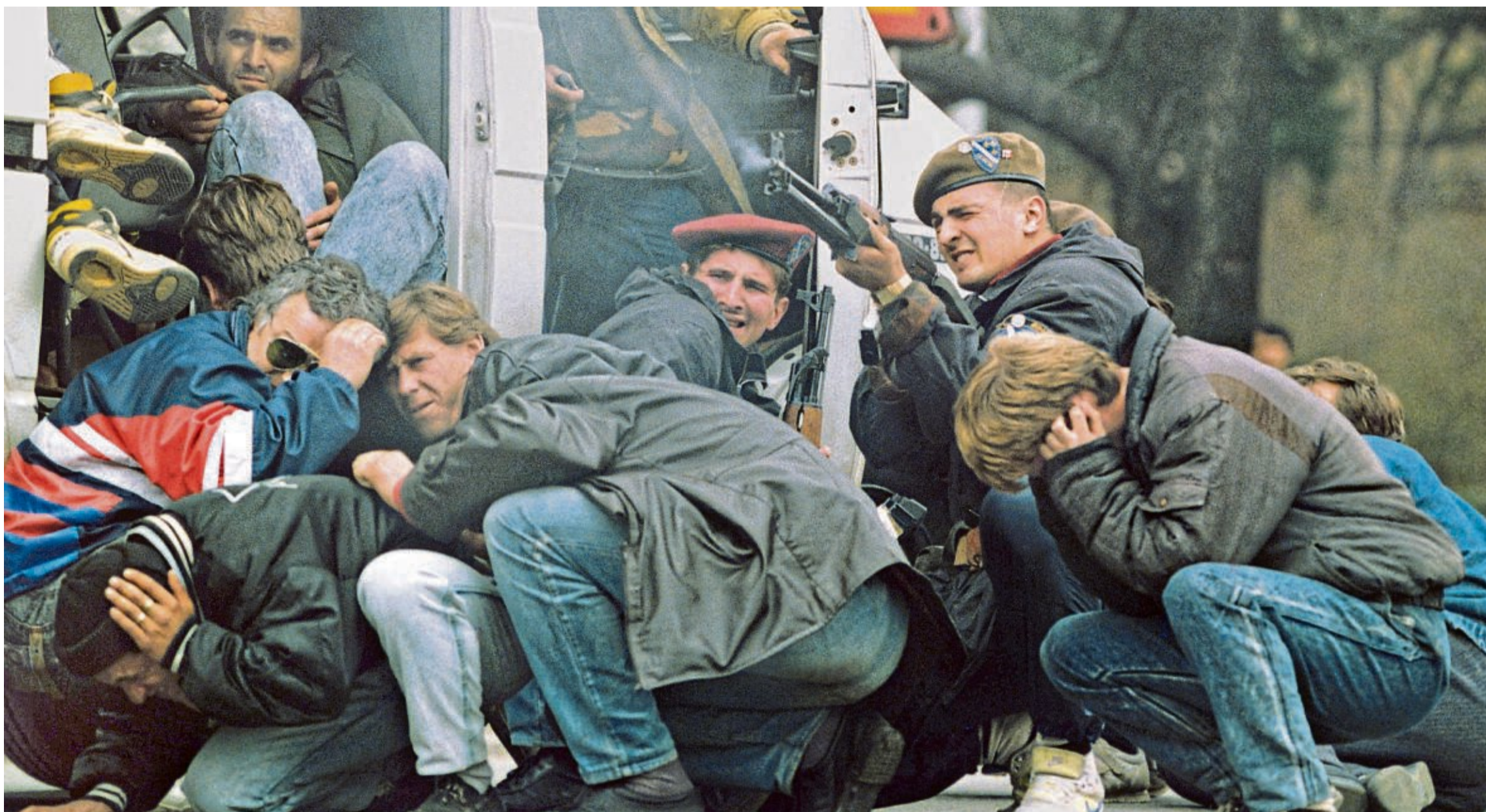
Bosnienkrieg: Zivilisten in Sarajewo suchen Schutz vor dem Beschuss durch bosnisch-serbische Truppen während ein Kämpfer der bosnisch-herzegowinischen Republik das Feuer erwidert.