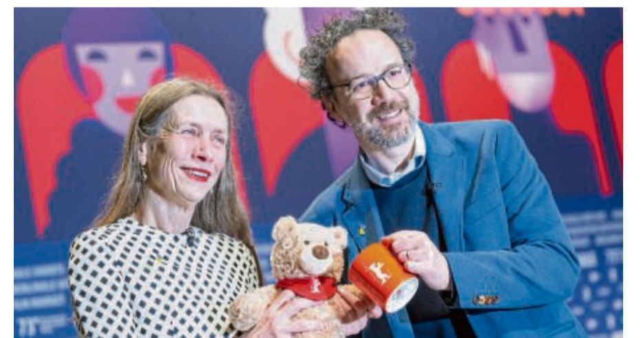
Leitungsduo der Berlinale: Mariette Rissenbeek und Carlo Chatrian