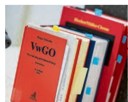
Die Verwaltungsgerichtsordnung wird auf zeitliche Straffung getrimmt.

In „geeigneten Fällen“ soll ein erster früher Erörterungstermin angesetzt werden, um eine gütliche Einigung zu erzielen beziehungsweise das Verfahren zu strukturieren. Im Regierungsentwurf war ursprünglich vorgesehen, dass dies in allen Verfahren innerhalb von zwei Monaten geschehen sollte. Dieser Vorschlag war in der Anhörung offensichtlich als kontraproduktiv kritisiert worden. Unverändert hingegen blieb die verschärfte Regelung zur innerprozessualen Präklusion. Nach Fristablauf vorgelegte Vorträge und Beweismittel sollen vom Gericht unbeachtet bleiben. Keine gesetzlich festgeschriebene Frist wird es indes für die Beklagten geben. Eigentlich hatte die Bundesregierung im Umwelt-