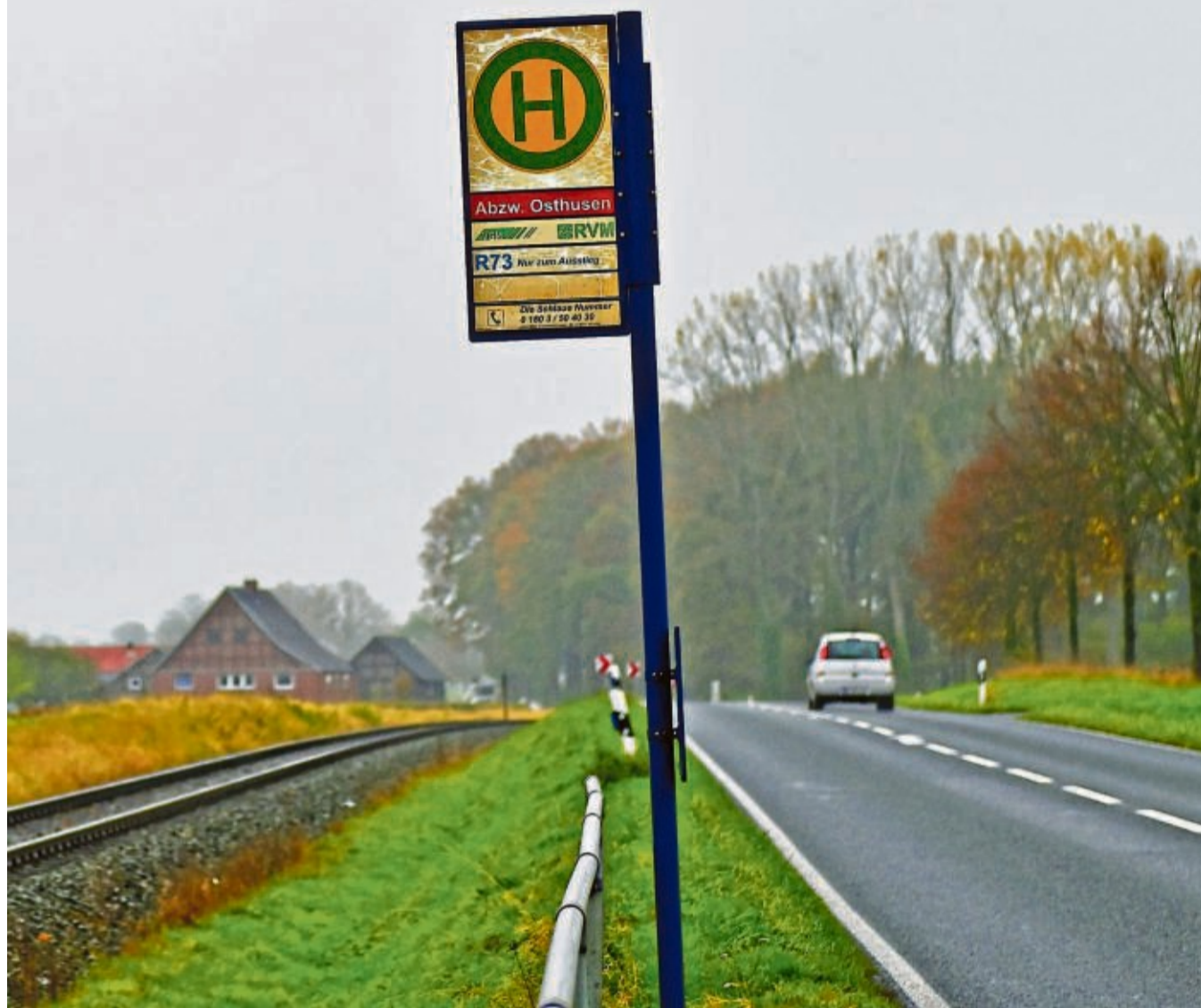
Bahn, Bus oder Auto: Gerade in ländlichen Regionen ist der ÖPNV noch deutlich unterentwickelt.

VERKEHR Ab dem 1. Mai soll der ÖPNV bundesweit mit einem Ticket für 49 Euro genutzt werden können. Die Opposition ist trotzdem nicht zufrieden