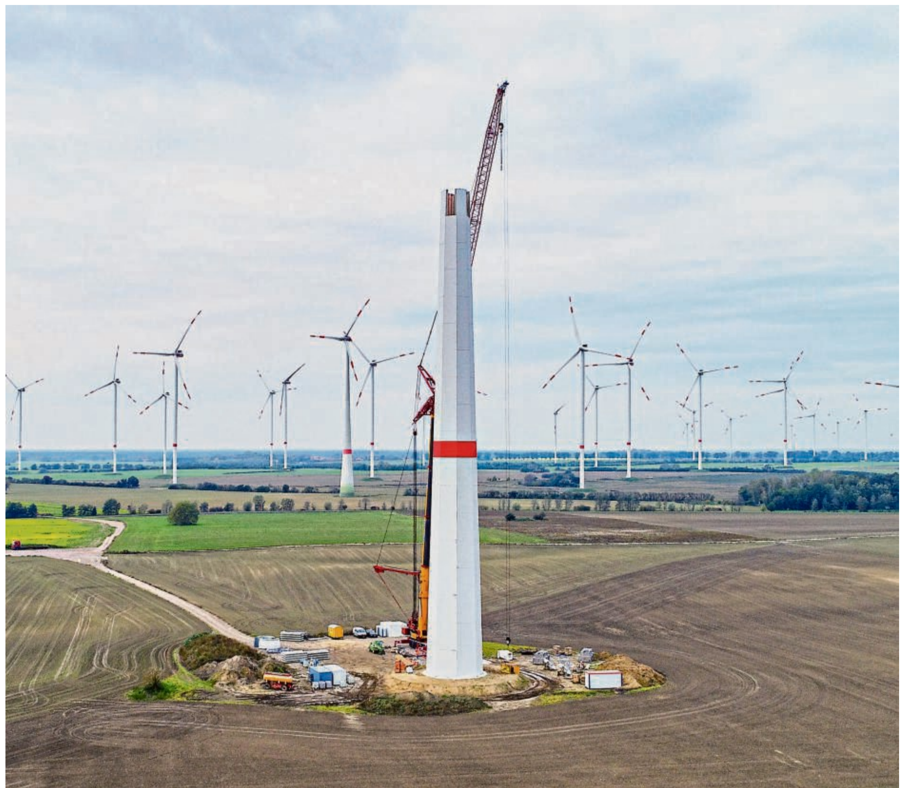
Planung, Genehmigung, Bau und Netzanschluss von Windkraftanlagen dauern rund fünf Jahre. Die Koalition will nicht nur solche Infrastrukturvorhaben beschleunigen. Über die Details gibt es aber noch Diskussionsbedarf in der Regierung.

de seitens der Investoren die Reißleine gezogen.