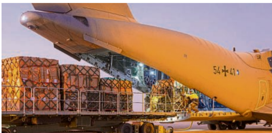
Die Luftwaffe der Bundeswehr schickt seit Donnerstag jeden Tag drei Maschinen mit Hilfsgütern in die betroffene Region.

Die Erdbebenkatastrophe in der Türkei und Syrien mit mindestens 22.000 Toten (Stand Freitag) hat auch im Bundestag für Trauer und Entsetzen gesorgt. Mit einer Schweigeminute gedachten die Abgeordneten am Mittwoch vor Eintritt in die Tagesordnung der Opfer, am Freitag wurde Trauerbeflaggung angeordnet. Der Ausschuss für Menschenrechte und humanitäre Hilfe beriet am Freitag in einer Sondersitzung über weitere Unterstützungsmaßnahmen. „Das Ausmaß an Tod, Zerstörung und Leid erschüttert uns zutiefst“, sagte Bundestagspräsidentin Bärbel Bas (SPD). Insbesondere in Syrien, wo die Not ohnehin schon besonders groß sei, verschärfe sich die Lage nun weiter. Umso wichtiger sei es deshalb, dass Hilfsorganisationen „schnell überall Zugang zum Katastrophengebiet bekommen“. Bas dankte im Namen des Hauses allen, die im Katastrophengebiet unter schwierigen Bedingungen helfen sowie „allen Menschen, die von Deutschland aus zu dieser Solidarität beitragen“. Bundeskanzler Olaf Scholz (SPD) versicherte zu Beginn seiner Regierungserklärung zum EU-Sondergipfel (siehe Seite 10), Deutschland liefere Hilfsgüter in die Türkei