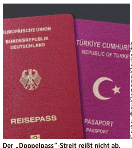
Der „Doppelpass“-Streit reißt nicht ab.

meidung der Mehrstaatigkeit wieder Geltung verschafft“, schreibt die Fraktion in der Vorlage weiter. Die Einbürgerung müsse im Grundsatz wieder als rechtlich gebundene Ermessensentscheidung im Einzelfall erfolgen. Dabei müsse die Ermessensausübung der einbürgernden Behörde davon geleitet sein, „nur solche Einbürgerungen vorzunehmen, durch die das Gemeinwesen durch Hinzufügung eines loyalen Neubürgers im politischen Sinne gestärkt wird“.