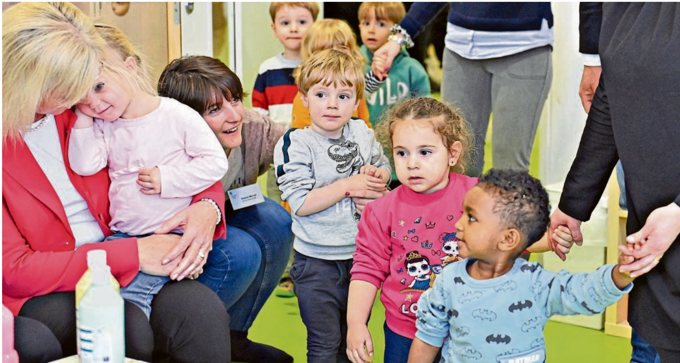
Seit 2013 gibt es einen Rechtsanspruch auf einen Betreuungsplatz für Kinder ab einem Jahr. Doch es gibt vielerorts noch immer zu wenig Kita-Plätze.