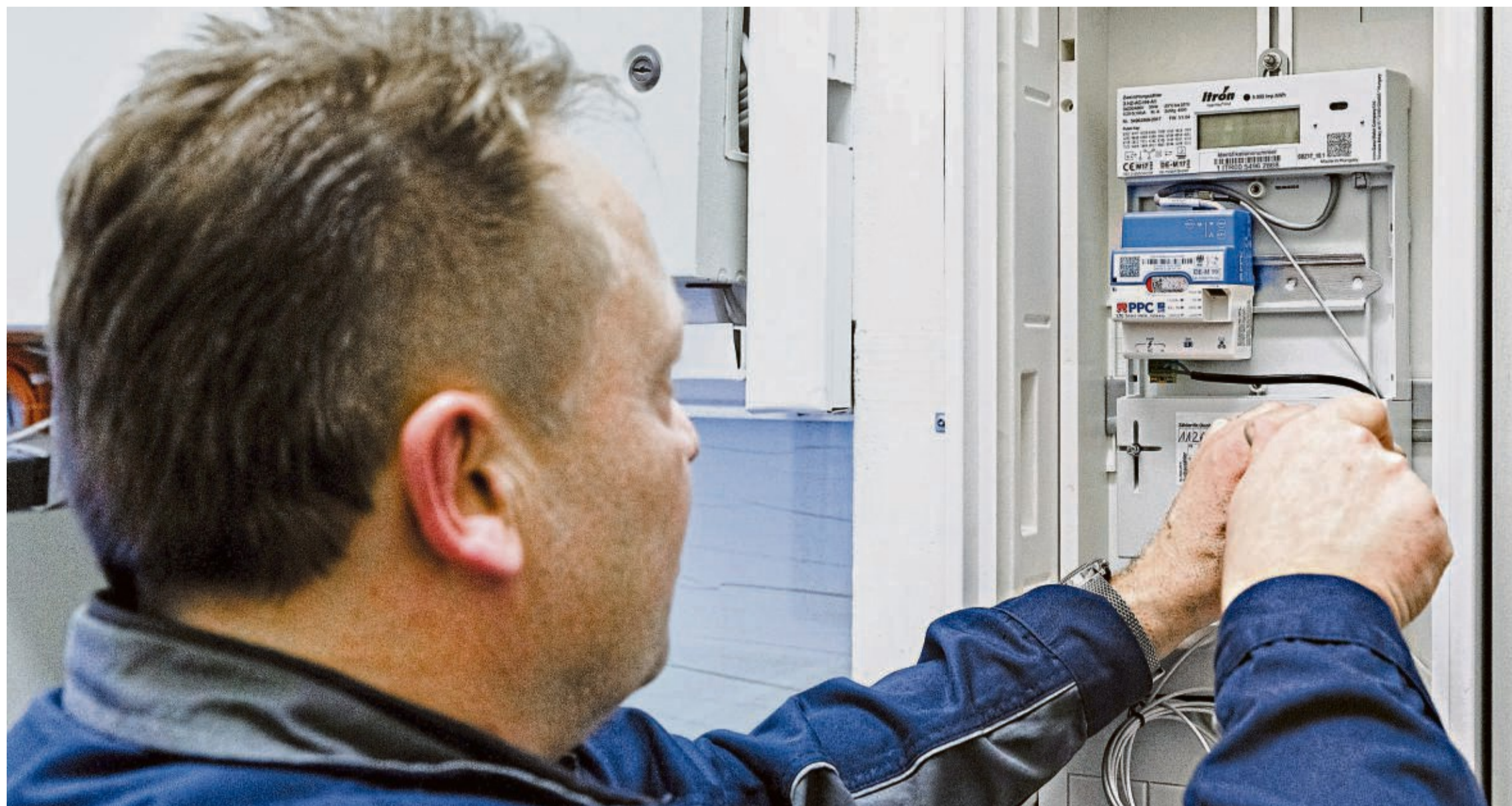
Mit einem Smart-Meter können Stromkunden kontrollieren, wie hoch der eigene Verbrauch ist, wo er aktuell entsteht und welche Geräte die größten Stromfresser sind.