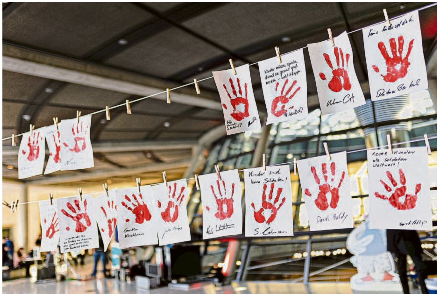
Ein Zeichen gegen die Rekrutierung von Kindersoldaten: Zahlreiche Abgeordnete nahmen am diesjährigen Red Hand Day teil.