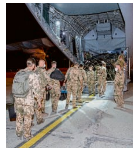
Rückverlegung der letzten Bundeswehrsoldaten aus Afghanistan im Juni 2021