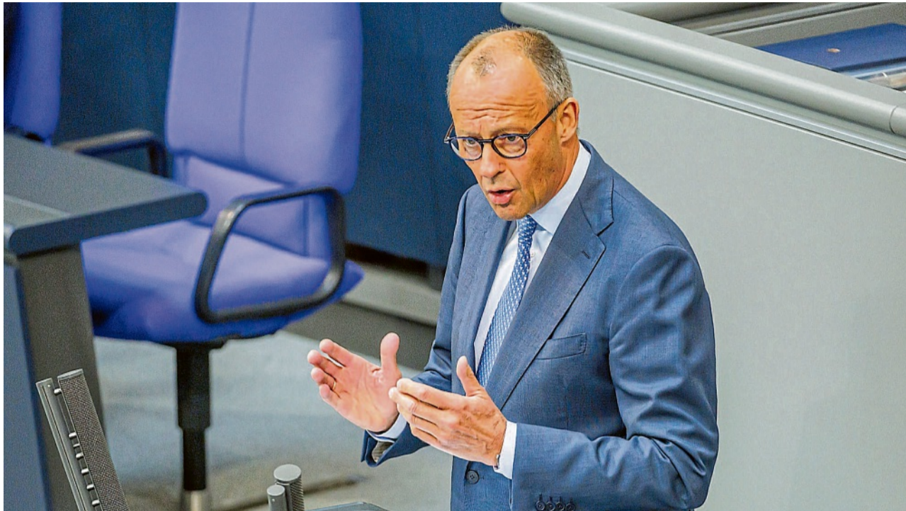
Friedrich Merz am Donnerstag im Bundestag: Gewillt, notwendige Reformen anzupacken, „unter schwierigsten Umständen und manchen Abgesängen zum Trotz“.

Doch Merz will zunächst über die Reformpläne seiner Regierung für Krankenkassen, Pflege, Rente sprechen – und sie verteidigen. Er spricht von zwei Optionen: „Entweder wir scheuen Veränderungen“ oder „wir nutzen die Stärken und Potenziale, die wir haben, um das Ruder für alle herumzureißen“. Die von ihm geführte Bundesregierung sei fest entschlossen, die Reformen anzugehen, „unter schwierigsten Umständen und manchen Abgesängen zum Trotz“, stellt er klar. Dann schlägt er doch den Bogen