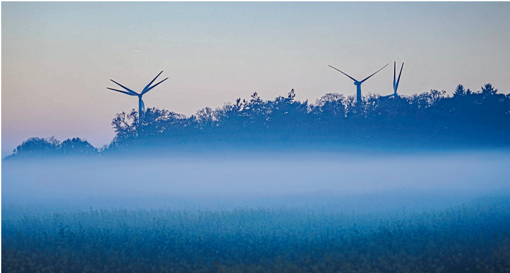
Um die Versorgungssicherheit in Deutschland während Dunkelflauten zu garantieren, plant die Bundesregierung die Ausschreibung von neuen Gaskraftwerken.