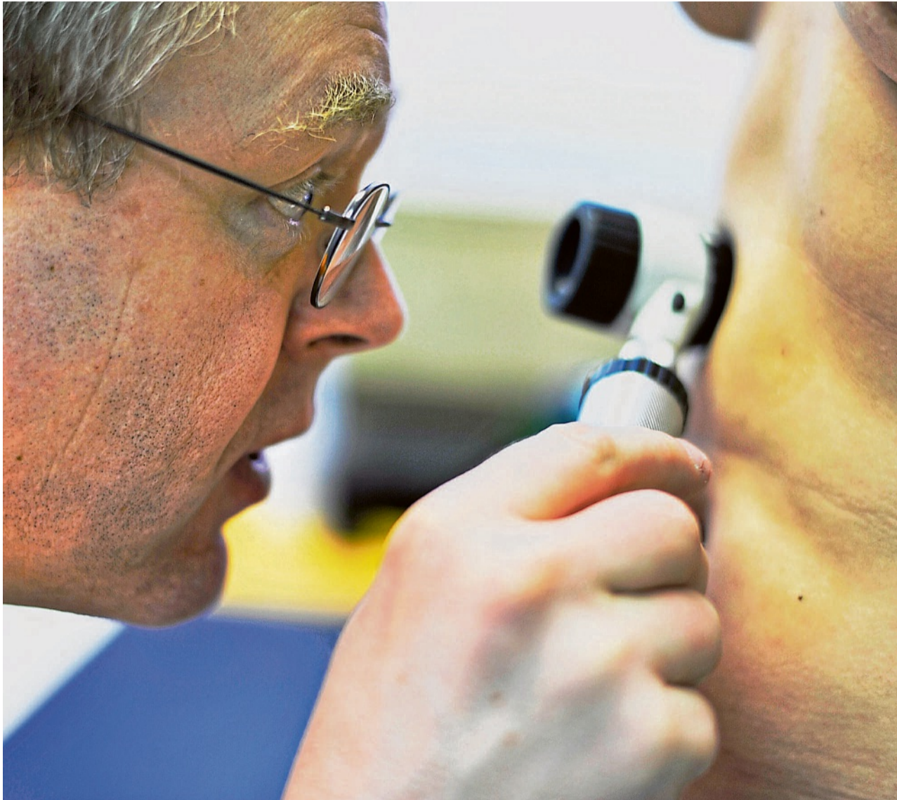
Mit der Reform soll auch das anlasslose Ganzkörper-Hautkrebs-Screening aus dem Leistungskatalog gestrichen werden.