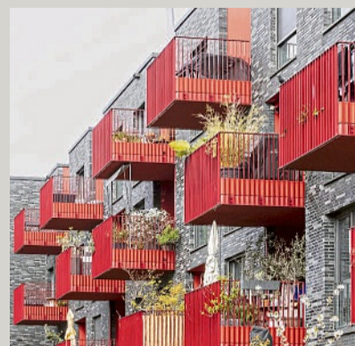
Grüne wollen mehr bezahlbare Wohnungen

Die Grünen fordern eine nachhaltige und soziale Stadtentwicklung sowie einen „Umbauturbo“, damit im Baurecht Umbau und Nachverdichtung priorisiert werden. Entsprechende Anträge (21/6340, 21/6341) wurden am Freitag vom Bundestag an den Bauausschuss überwiesen. Vor allem soll mehr leerstehender Büroraum zu Wohnungen umgebaut werden. hle