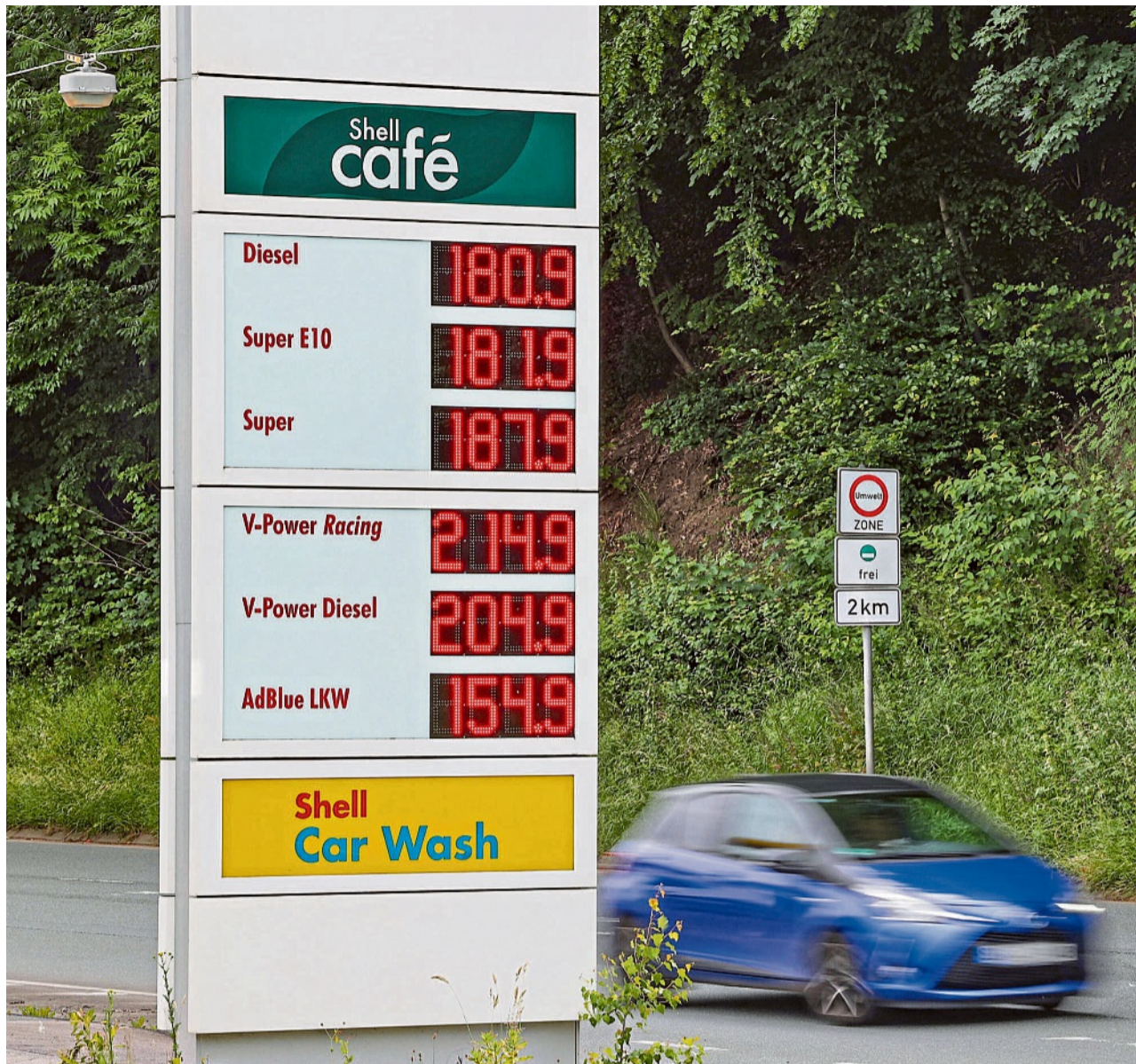
Noch gibt es Sprit für unter zwei Euro pro Liter. Spannend wird, wie es nach dem Ende des Tankrabatts weitergeht.