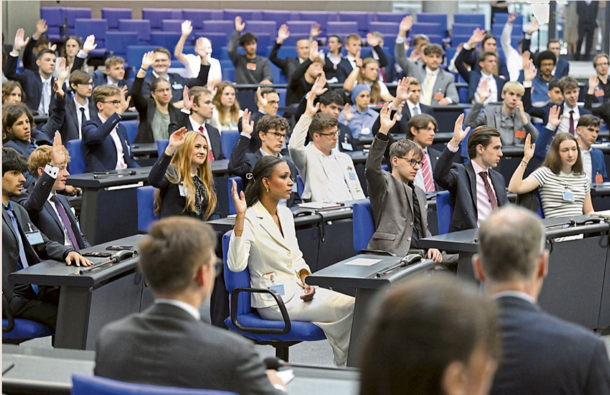
Seltenes Privileg: Die 270 Teilnehmerinnen und Teilnehmer am Planspiel durften als „Abgeordnete“ in den Plenarsaal.

Bisweilen mussten die Sitzungsleiter – die Bundestagsvizepräsidentinnen Josephine Ortleb (SPD) und Andrea Lindholz (CSU) und Bundestagsvizepräsident Bodo Ramelow (Die Linke) – eingreifen, um allzu lauten Jubel zu dämpfen oder Fragesteller aufzufordern, den Antworten der Redner im Stehen zuzuhören. Das Rollenspiel funktionierte: Die Koalition aus „Gerechtigkeitspartei“ und „Partei für Engagement und Verantwortung“ sowie die oppositionelle „Bewahrungspartei“ tauschten Argumente aus und sparten nicht mit Kritik: „Sie sind die Partei der Lebensferne!“ Die Abstimmung über eine Klarnamenpflicht in den Sozialen Medien, ein Verbot von Flügen auf Strecken unterhalb von 600 Kilometern, den Aufbau einer umfassenden Partnerschaft mit Staaten der Ostafrikanischen Gemeinschaft sowie die Ver-