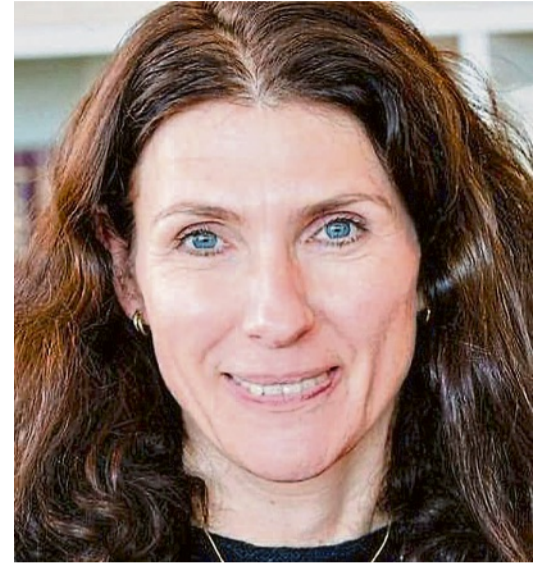
Heike Haarhoff © Privat

Auf den ersten Blick wirkt es wie Schock zur Unzeit: Die Krankenkassen ächzen unter einem Defizit im zweistelligen Milliardenbereich, Arzneimittel zählen zu den großen Ausgabenblöcken, und doch soll die Pharmaindustrie beim GKV-Beitragsstabilisierungsgesetz nicht in dem Maß herangezogen werden, das ihrem Kostenteil entspricht. Wer nur auf die Kassenlage schaut, wird Klientelpolitik vermuten. Wer auf den Standort und auf den medizinischen Fortschritt schaut, dürfte vorsichtiger urteilen.