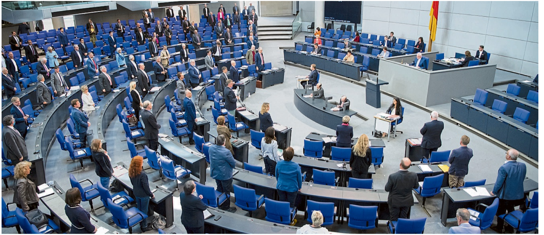
Stehend stimmen die Abgeordneten zu Corona-Zeiten im Mai 2020 für einen Verzicht auf die damals anstehende Erhöhung der Abgeordnetendiäten.

Eine solche Aussetzung hatten in eigenen Gesetzentwürfen zuvor bereits Die Linke (21/5588) und die Grünen (21/6004) gefordert; ein Gesetzentwurf der AfD (21/331) vom vergangenen Jahr zielt auf eine Streichung der automatischen Diäten-Anpassung.