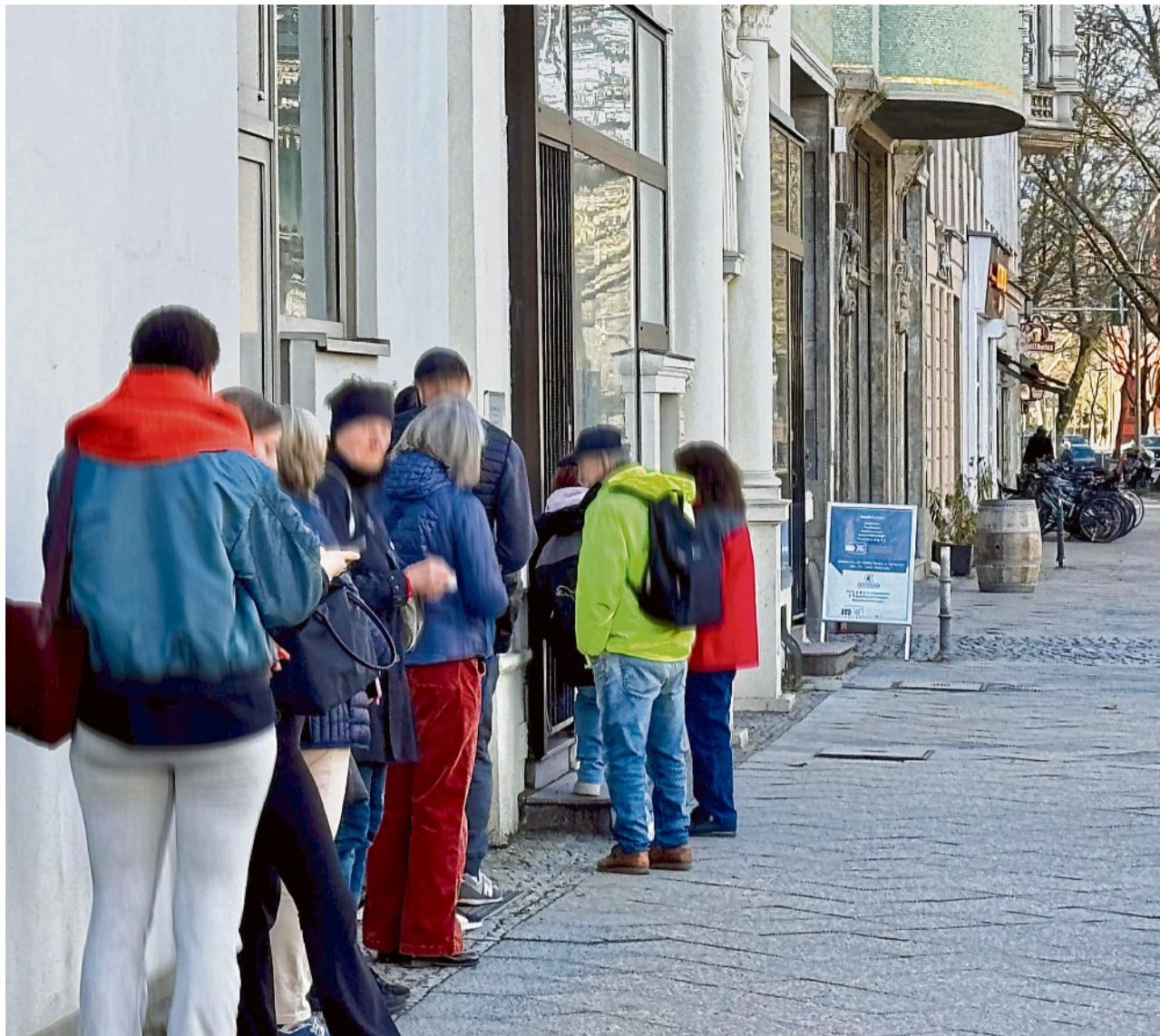
Wohnungssuche in Berlin: Menschen mit einem nichtdeutschen Namen haben oft schlechtere Chancen.