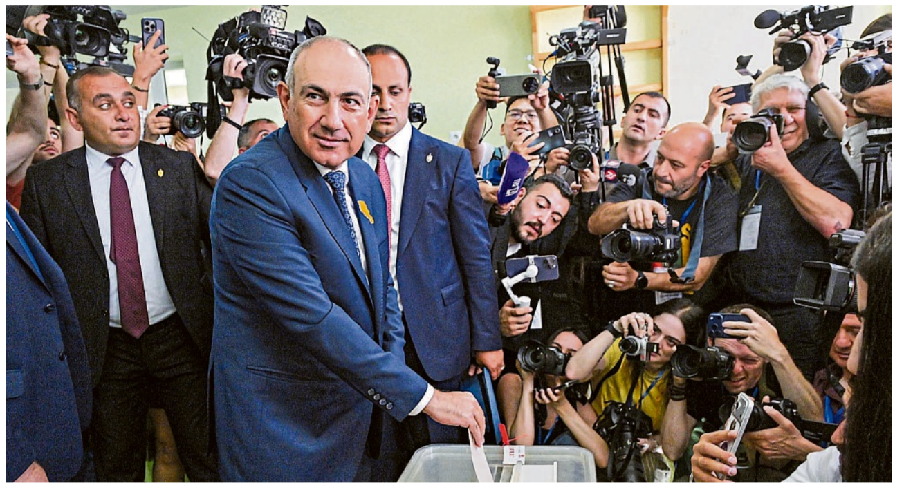
Wahlsieger Nikol Paschinjan am 6. Juni bei der Stimmabgabe. Die Parlamentswahl in Armenien galt als richtungweisend für die künftige geopolitische Orientierung der Kaukasus-Republik.

Nikol Paschinjan regiert Armenien seit 2018. Seither versucht er, eine funktionierende Demokratie aufzubauen und die Korruption zu bekämpfen – und Russland zugleich im Boot zu halten. Aus gutem Grund: Armenien ist in hohem Maße abhängig von Russland, besonders militärisch. Die Beteiligung seines Landes an dem von Russland dominierten Militärbündnis OVKS setzte Paschinjan allerdings im Februar 2024 aus, nachdem Russland ihm im Konflikt mit Aserbaidschan um die von Armenien besetzte und damals fast vollständig