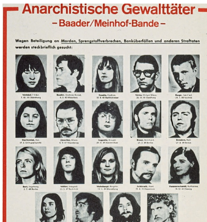
Der neue Paragraf zielte vor allem auf die RAF.