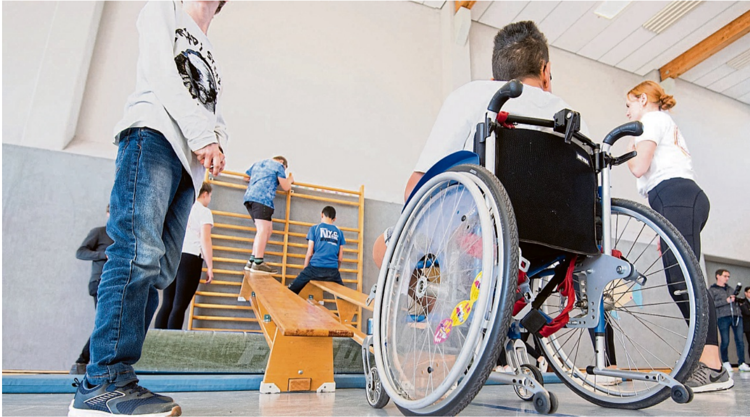
Schüler mit und ohne Behinderung beim gemeinsamen Unterricht an einer Schule in Celle. Manche Schüler benötigen eine persönliche Assistenz, um am Unterricht teilnehmen zu können. Betroffene Eltern und Kinder befürchten das Aus für diese Unterstützungsleistung.