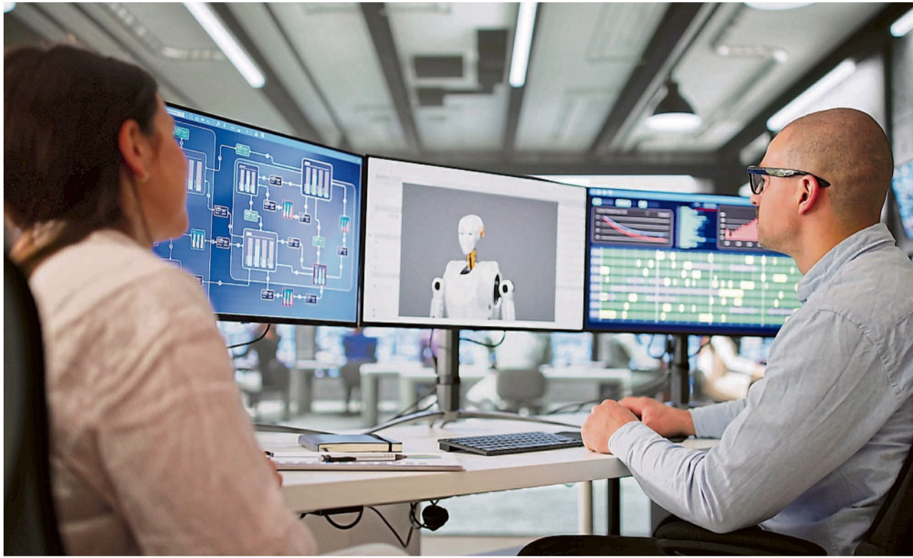
Die Bundesregierung will Digitalexpertise bei der Bundesnetzagentur bündeln, um Unternehmen möglichst einen einzigen Ansprechpartner zu geben. Das Ziel: für den sicheren Einsatz von Produkten mit Künstlicher Intelligenz zu sorgen.

Den geänderten Gesetzentwurf der Bundesregierung für ein KI-Marktüberwachungs- und Innovationsförderungs-Gesetz (21/4594) nahm der Bundestag am Donnerstag mit den Stimmen der Koalitionsfraktionen an. AfD, Bündnis 90/Die Grünen und die Linksfraktion stimmten dagegen. Anträge von Linken und Grünen für eine Verschärfung der KI-Verordnung und ein weitreichendes Verbot biometrischer Fernidentifizierung (21/4758; 21/4759) sowie zu einer anderen nationalen Umsetzung der Ver-