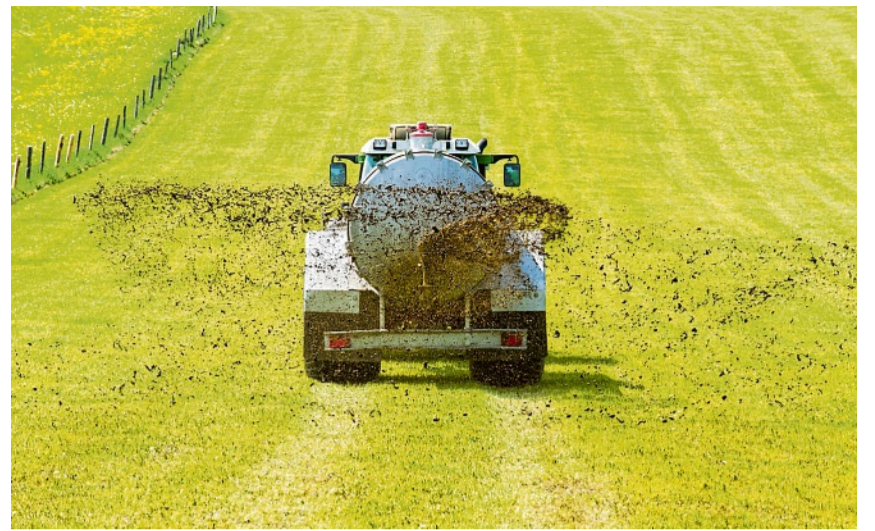
Die Auswirkungen von Düngemaßnahmen auf Gewässer sollen künftig durch ein bundesweites Monitoring besser überprüft werden.

> Zulassungspflicht Erstmals müssen alle Hersteller ihre Verpackungen lizenzieren lassen.