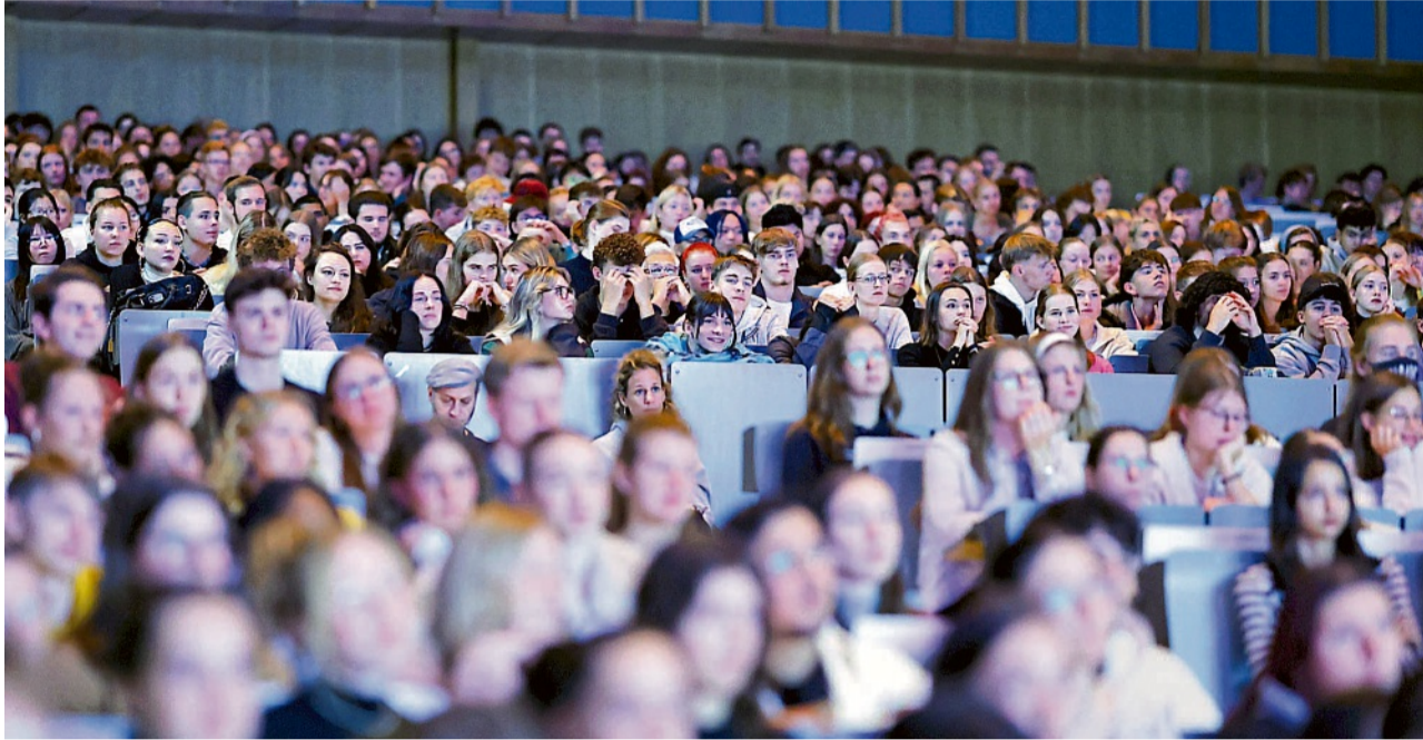
Die gestiegenen Lebenshaltungskosten sind für viele Studierende in Deutschland zur großen finanziellen Belastung geworden. Nur noch rund elf Prozent von ihnen erhalten Bafög.

Während die Bundesregierung laut einer Aussage der Parlamentarischen Staatssekretärin des Forschungsministeriums aktuell nach einer Lösung suche, um den Gesetzentwurf wie vorgesehen Ende Juli ins Kabinett einzubringen, hat die Opposition das Thema bereits diese Woche auf die Agenda des Bundestages gesetzt. Gleich zweimal debattierten die Abgeordneten am vergangenen Donnerstag über Vorschläge der Opposition zu einer Novelle des Bafög. Am Nachmittag stand ein Antrag der Linken (21/6359) auf der Tagesordnung, der zur weiteren Beratung an den Forschungsausschuss überwiesen wurde. Die Abgeordneten fordern darin von der Bundesregierung einen