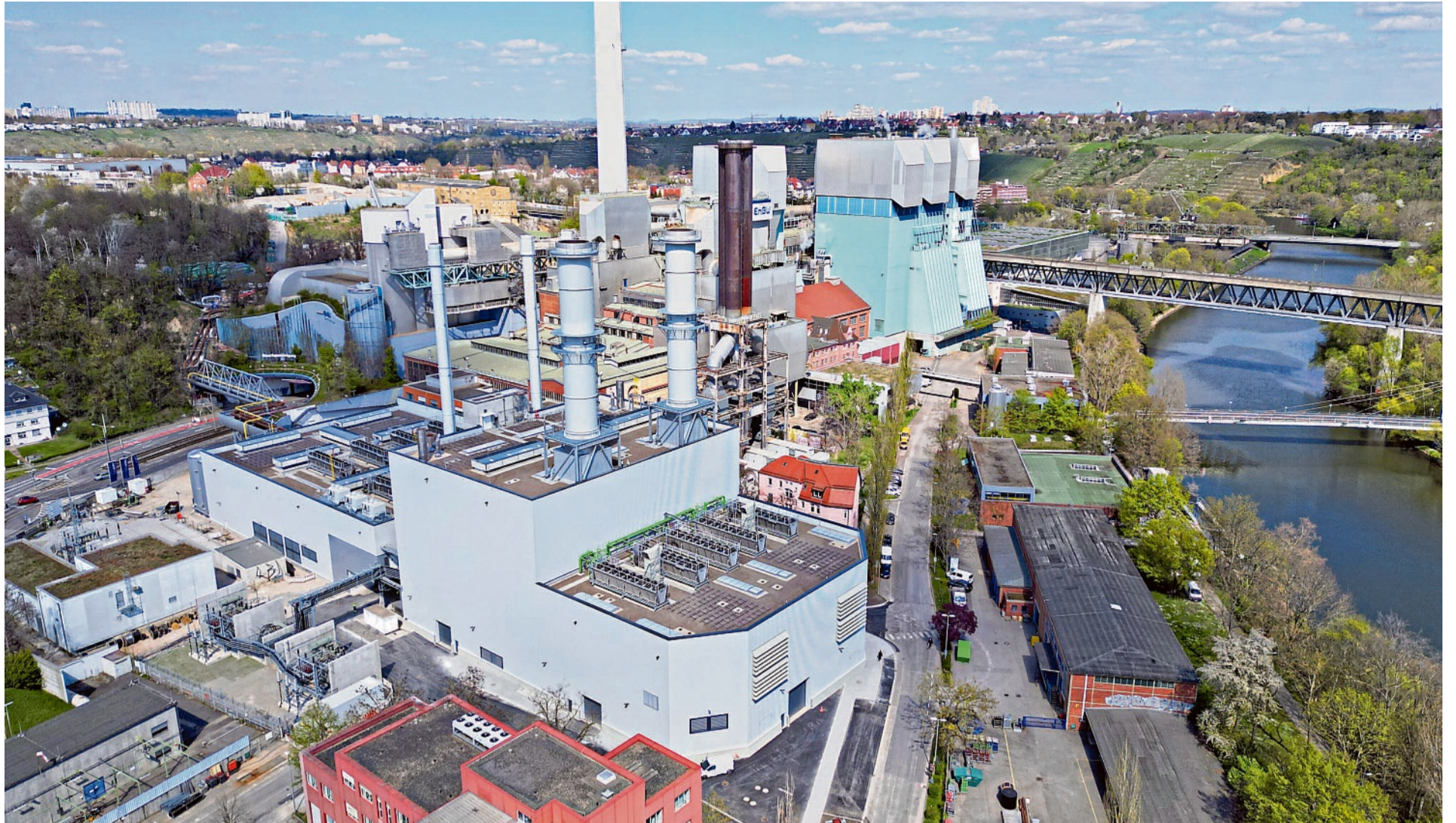
Das Gaskraftwerk des Energieversorgers EnBW in Stuttgart-Münster ist im Frühjahr 2025 in Betrieb gegangen. Das Fuel-Switch-Kraftwerk ist wasserstofffähig und kann neben Erdgas auch klimaneutrale Brennstoffe wie grünen Wasserstoff nutzen. Die Anlage gilt als Vorbild für die geplanten Kraftwerksneubauten.

Der Heizungsstreit hatte sich im Frühsommer 2023 zu einer Regierungskrise entwickelt. Ausgangspunkt war ein von der Ampelkoalition aus SPD, Grünen und FDP beschlossener Entwurf (20/6875) zur Änderung des Gebäudeenergiegesetzes (GEG), den der damalige Wirtschaftsminister Robert Habeck (Grüne) vorgelegt hatte. Anstatt über das Gesetz abzustimmen, kam es am 24. Mai 2023 in einer Aktuellen Stunde im Bundestag zu einem heftigen Schlagabtausch. „Ziehen Sie den Gesetzentwurf zurück! Gehen Sie zurück auf los und fangen Sie (...) noch mal ganz von vorne an, und zwar mit einer Novelle zum Gebäudeenergiegesetz, (...) die wirklich technologieoffen ist – ohne diese Fixierung auf die Wärmepumpe“, forderte Jens Spahn (CDU) in der Debatte. Trotzdem wurde das GEG wenige Monate später verabschiedet, blieb als „Habecks Heizungs-Hammer“ aber Zankapfel. Nachdem die Ampelregierung im November 2024 zerbrochen war und die Union die darauffolgende Bundestagswahl im Februar 2025 gewonnen hatte, schrieben CDU/CSU und SPD in ihrem Koalitionsvertrag: „Wir werden das Heizungsgesetz abschaffen.“ Nun soll das umstrittene Gesetz tatsächlich bald Geschichte sein. Die